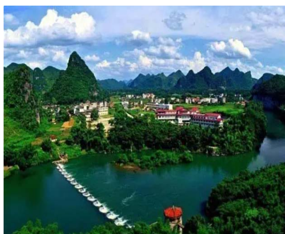
宜州刘三姐故居的必经之地一下枳河