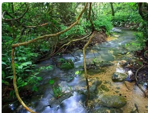
罗城县小长安镇水上相思林

河池是一座以壮族为主的多民族聚居城市，是广西壮族自治区少数民族聚居最多的地区之一，是主要的喀斯特旅游地貌资源分布区，喀斯特旅游地貌资源占河池国土面积的 65.74%，是名副其实的喀斯特王国。河池市内的河流主要为红水河、龙江及其支流，蕴藏着巨大水力资源。